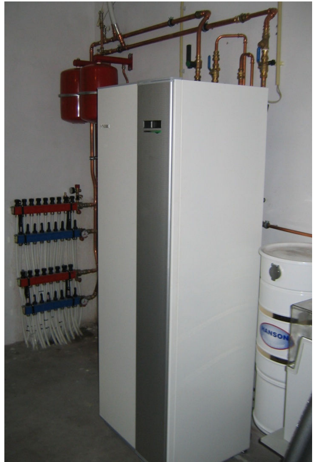
Warmtepompinstallatie in de garage