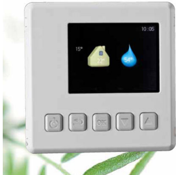
Eenvoudig temperaturen aanpassen