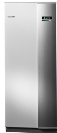
Moderne zeer stille warmtepomp