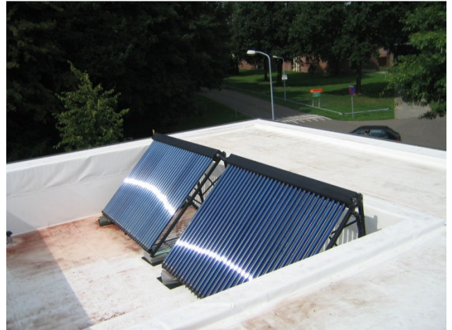
Warmtepomp in combinatie met zonnecollectoren